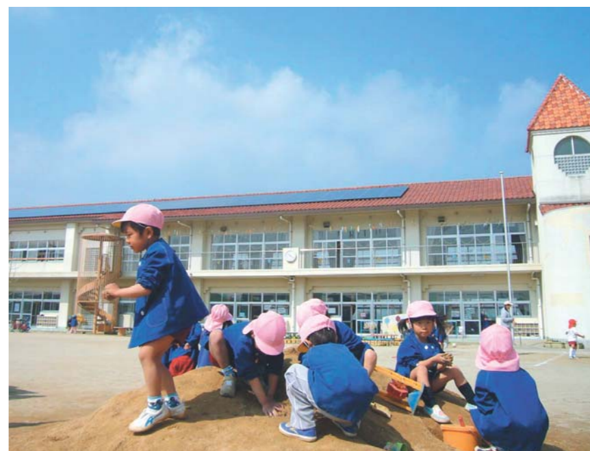
幼稚園に設置された太陽光パネル

「おかやまさんさん発電所」は、幼稚園など17カ所に太陽光発電設備335kW（一般家庭に導入している太陽光発電約80世帯分）を設置しました。これにより年間約35万kW発電し、約200トン-CO 2 のCO 2 を削減（一般家庭の排出量約40世帯分）。環境教育にも有効活用されています。この発電所は「オンサイト太陽光発電ビジネスモデル」（下記参照）により、施設側は毎月の電気代と同じ料金を支払うのみで設置できます。これは事業所における普及のビジネスモデルとして大いに期待されています。