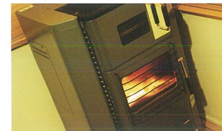
ペレットストーブ

当社のバイオマス事業は、ペレット燃料や薪の販売、ペレットストーブや薪ストーブの販売のほか、森林バイオマスの活用に関する様々な事業を通じて、CO2削減、雇用創出、森林管理、里山保全に貢献いたします。