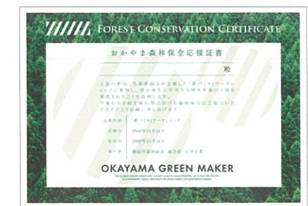
おかやま森林保全応援証書