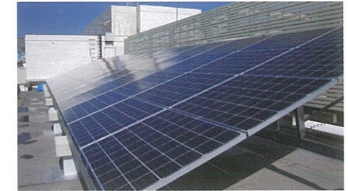
太陽光発電 財団法人 岡山県環境保全事業団様