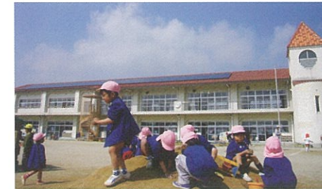
太陽光発電 瀬戸内市立行幸幼稚園様