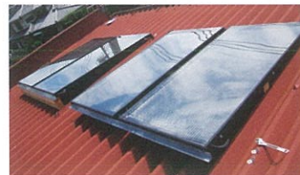
社会福祉法人 備前市社会福祉事業団様 (デイサービスセンター大ヶ池荘)