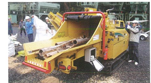
森林バイオマスの活用