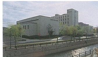
赤穂ロイヤルホテル様