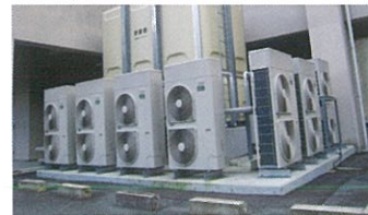
社会福祉法人 春秋会様